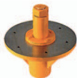
Virola de una pieza en fundición Die-cast bearing support